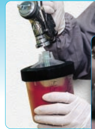
De verfspuit wordt bevestigd op het PPS systeem

Wanneer de lucht uit de beker is geblazen en de lak is aangevoerd, kan vanuit iedere gewenste hoek gespoten worden