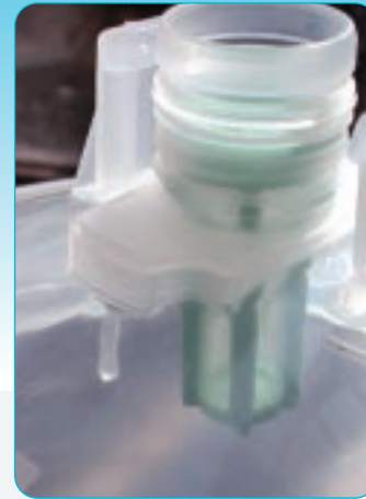
Geïntegreerd PPS lakfilter voorkomt stofjes in de lak